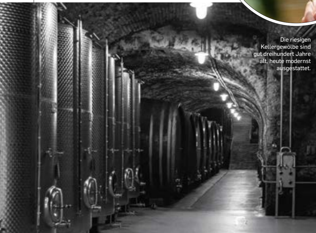
Die riesigen Kellergewölbe sind gut dreihundert Jahre alt, heute modernst ausgestattet.

B ereits im Jahr 1137 wurde in einer Urkunde das »Weingut der Herrschaften Dürnstein und Thal Wachau« erwähnt. Im Laufe der Geschichte wechselten die aristokratischen Besitzer, dazu gab es in den Wachauer Weinbergen zahlreiche kirchliche Besitzungen auswärtiger Klöster, meist solcher aus Bayern, Salzburg und Oberösterreich. Auch im malerischen Städtchen Dürnstein gab es neben dem Schloss – heute ein tolles Hotel – als Sitz der Herrschaft ein Kloster der Augustiner Chorherren, deren Prälat in der Barockzeit nicht nur die zauberhafte, heute wieder strahlende blaue Stiftskirche zum Beten, sondern auch ein kleines Lustschloss am Fuße des Kellerberges errichten ließ. Dieses »Kellerschlüssel« sollte später zum Wahrzeichen der Domäne Wachau werden.