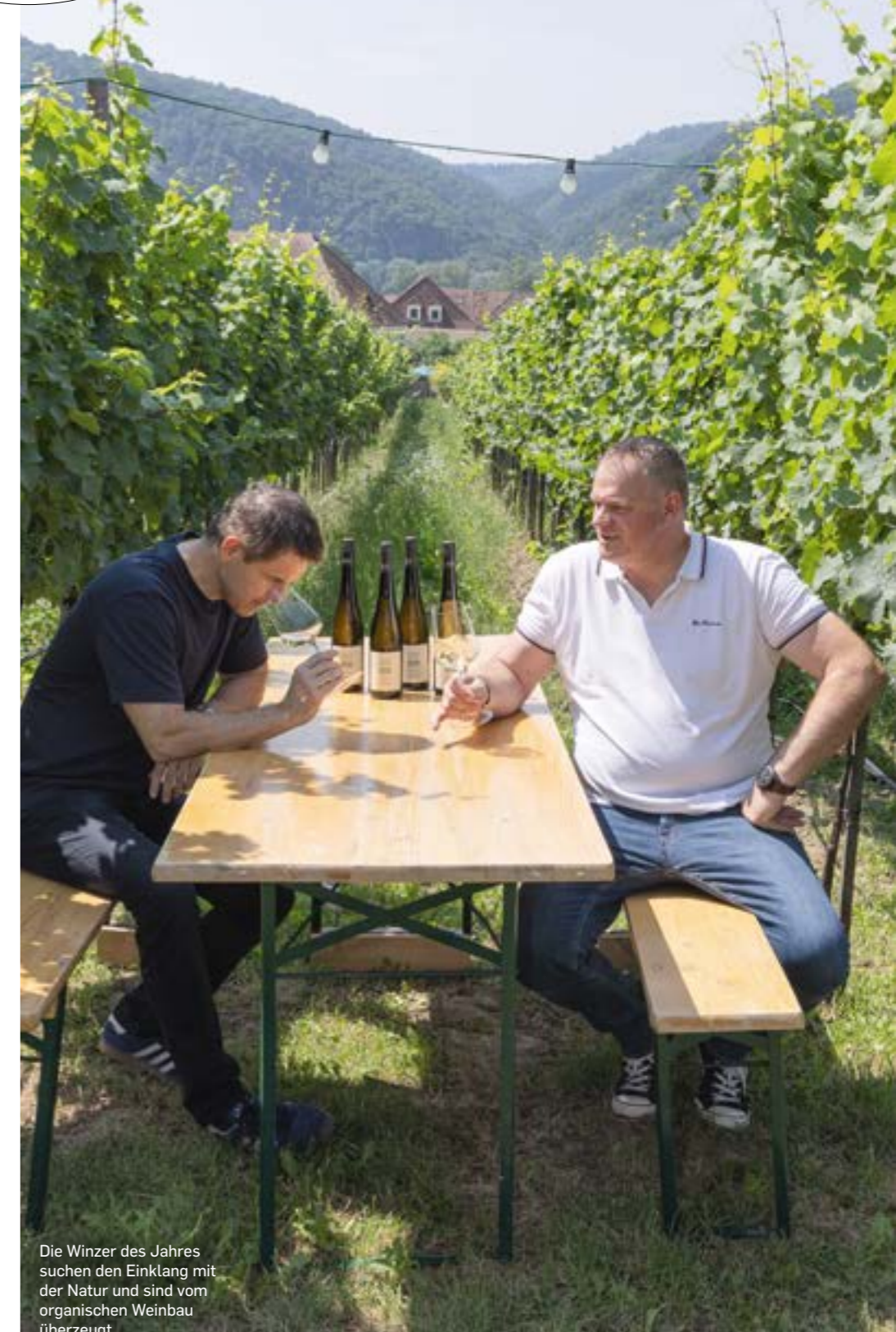
Die Winzer des Jahres suchen den Einklang mit der Natur und sind vom organischen Weinbau überzeugt.